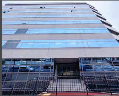
当社ビル正面エントランス

※正面エントランスから入ったフロアは2階となります。エレベーターか階段で1階にお下がりください。 エレベーターを出て右手に当社オフィスがございます。